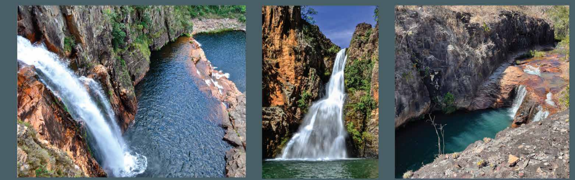
Macaco Macaquinhos Paraíso dos Cactos