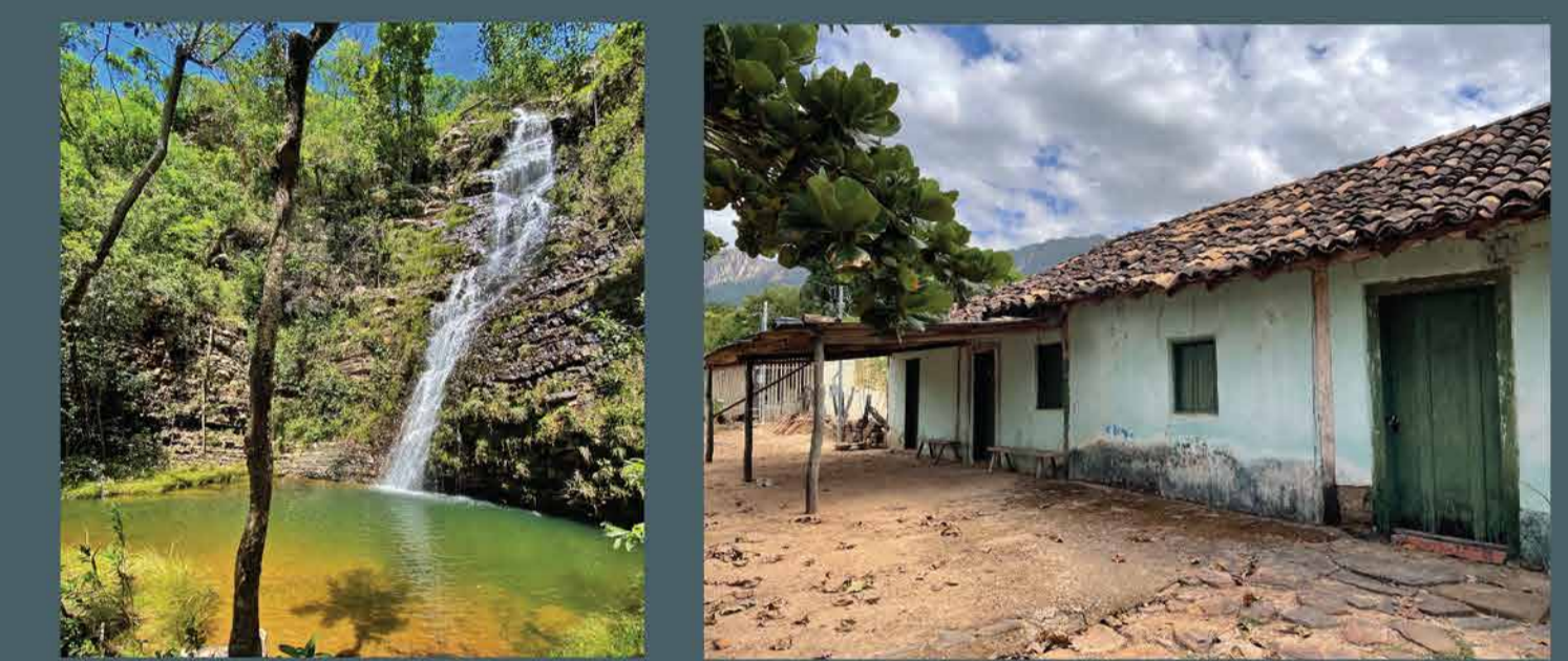
Complexo Veadeiros Comunidade do Forte