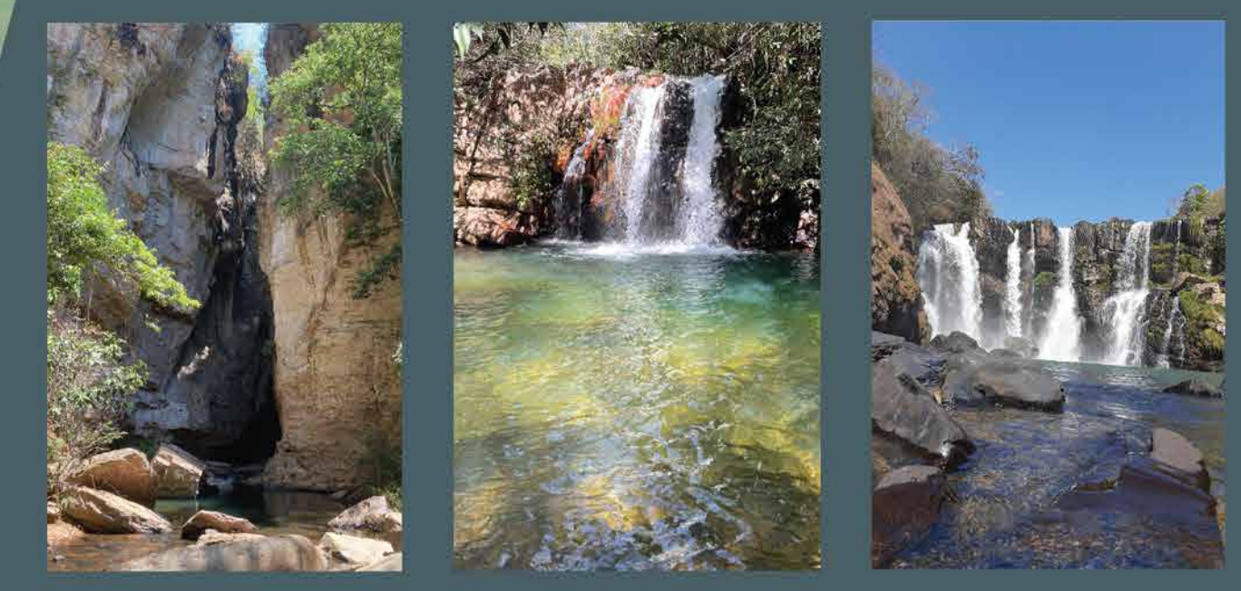
Bocaina do Farias Bonito Cantinho