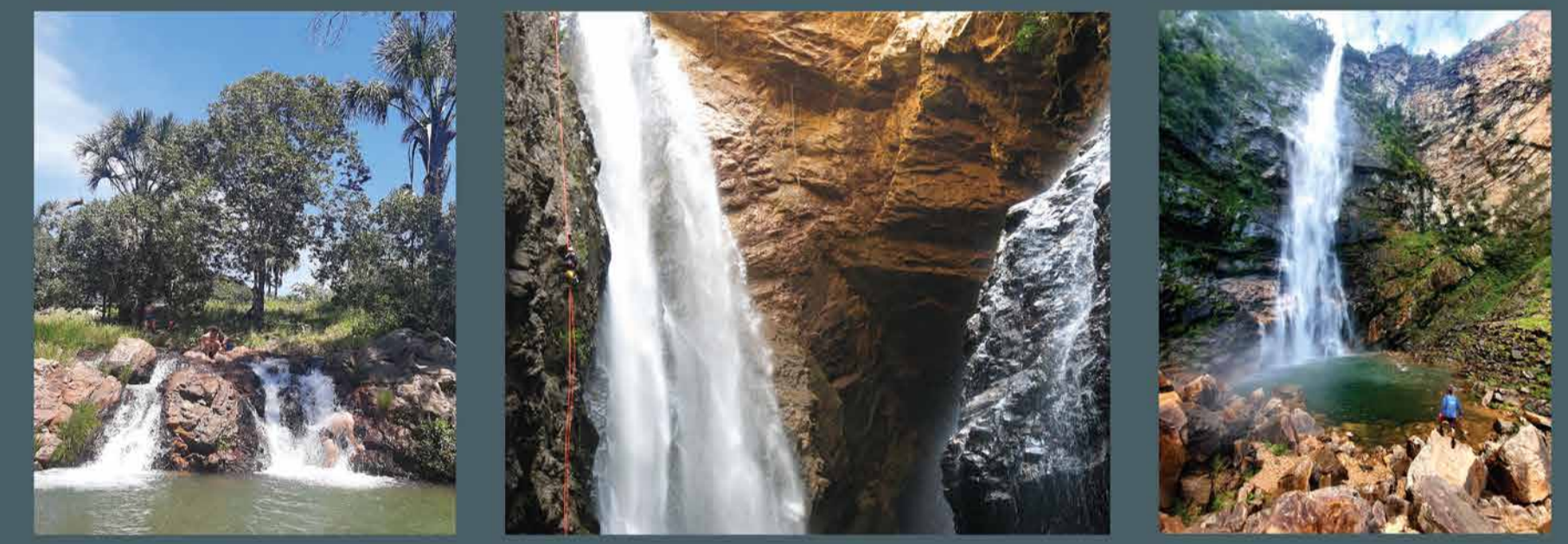
Dominguinhos Dragão Label